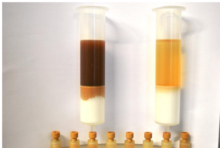
Figura 1 – Esempio di estrazione SPE

Per garantire l'assenza di polifenoli nell'eluato dopo il passaggio attraverso la colonna, aggiungere a 3 mL di soluzione di solidi detannizzati (SD) 3 gocce di soluzione acquosa di \text{FeCl}_3 . Se si osserva una variazione di colore verso una sfumatura nero-bluastro, i polifenoli sono passati attraverso il polimero; pertanto, è necessario ripetere l'analisi riducendo il peso iniziale del prodotto. Qualora la soluzione rimanga incolore dopo il trattamento con le 3 gocce, si può procedere con l'analisi gravimetrica.